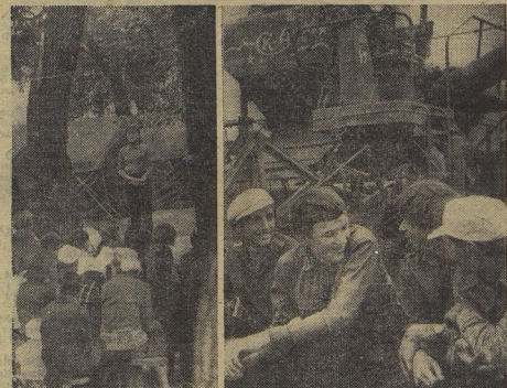
НА СНИМКАХ (сверху вниз): ● Работа в радости. ● Награды лучшим вручает первый секретарь ЦК ВЛКСМ Е. М. Тяжельников. ● Съёт высадил трудовой десант в старопольских садах. Ребята помогли колхозам в уборке фруктов. ● И в палаточном городке, и в поле у комбайна делились делегаты мыслями.